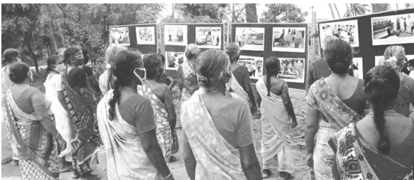
கரூர் மாவட்டம், புகளூர் ஊராட்சி, கட்டபாளையத்தில் செய்தி மக்கள் தொடர்பு துறையின் சார்பில் நடத்தப்பட்ட சாரண விளக்க புலகப்படி கண்காட்சியினை ஏராளமான பொதுமக்கள் பார்வையிட்டனர்.