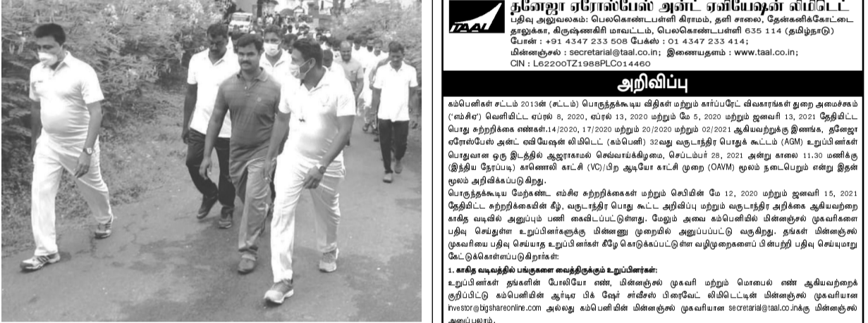
தனியார் ஏரோபோஸ் அன்ட் ஏர்லேயூன் லிமிடெட் புதி அலுவலகம் வெள்ளையூர் பிளாஸ், தரிசனம், தஞ்சையிலேயே உள்ளது. கிழக்கு மண்டலம், வெள்ளையூர், சென்னை 605 114 (தமிழ்நாடு) மின்னஞ்சல்: secretarial@tal.co.in; இணையத்தளம்: www.tal.co.in; CIN: L62200T21989PLC01460